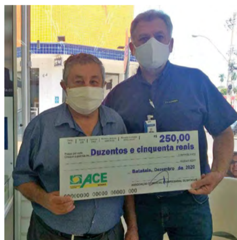
Óticas Carol - José Ribeiro da Costa